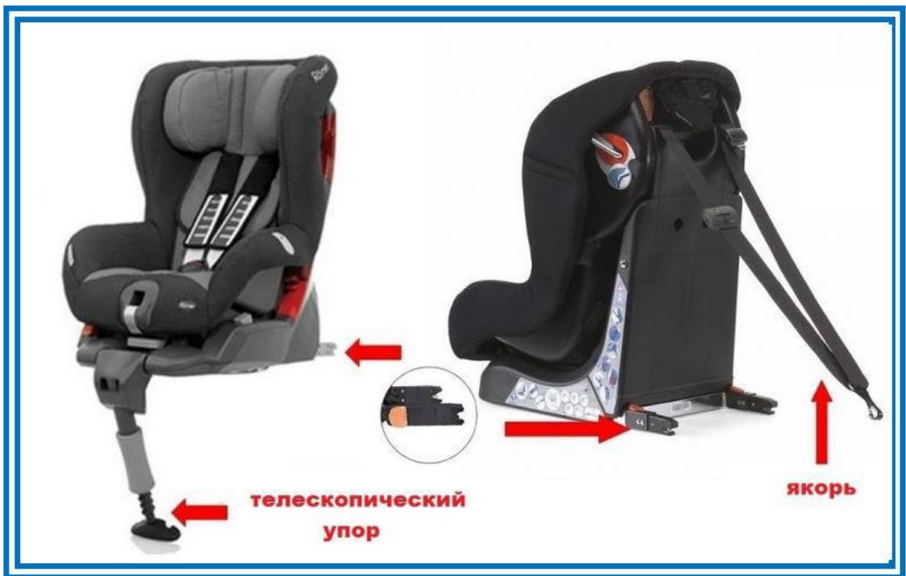
Рисунок 6. Телескопический упор и якорное крепление

Телескопический упор и якорное крепление разработаны специально для того, чтобы в момент столкновения снизить нагрузку на основное крепление детского автокресла, избежать возможности «клюющего» движения при лобовом столкновении и этим обеспечить более высокую безопасность в аварийных ситуациях.