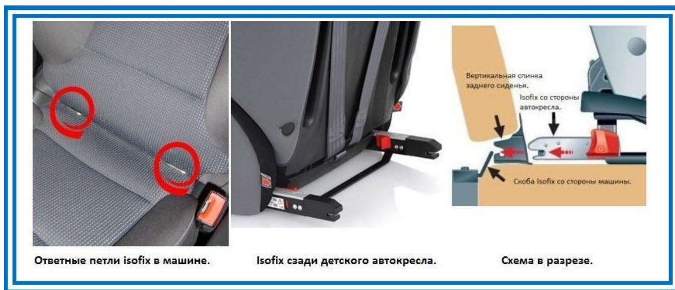
Рисунок 5. Крепления ISOFIX

Система крепления ISOFIX дает возможность быстрого и надежного крепления. За счет быстрозажимных устройств кресло надежно фиксируется и также легко снимается. Не приходится лишний раз беспокоить ребенка.