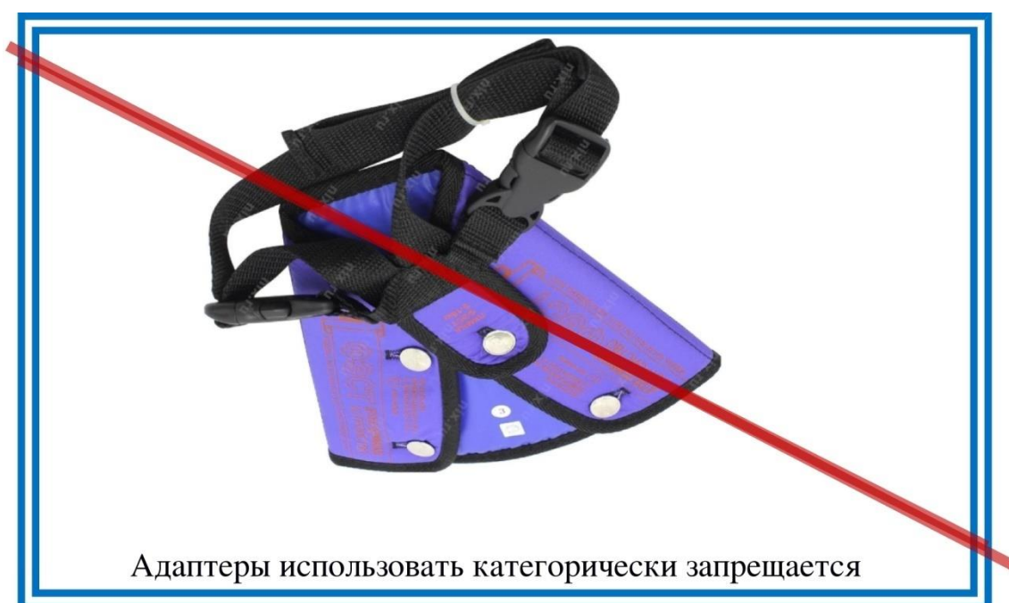
Рисунок 2. Внешний вид адаптера

Кроме представленных детских удерживающих устройств в магазинах еще продаются адаптеры как фирмы «ФЭСТ», так и других фирм. Госавтоинспекция выступает категорически против их применения, так как при ДТП адаптер оказывает слишком высокие нагрузки на брюшную полость ребенка, практически врезается в нее, что приводит к травмированию внутренних органов.