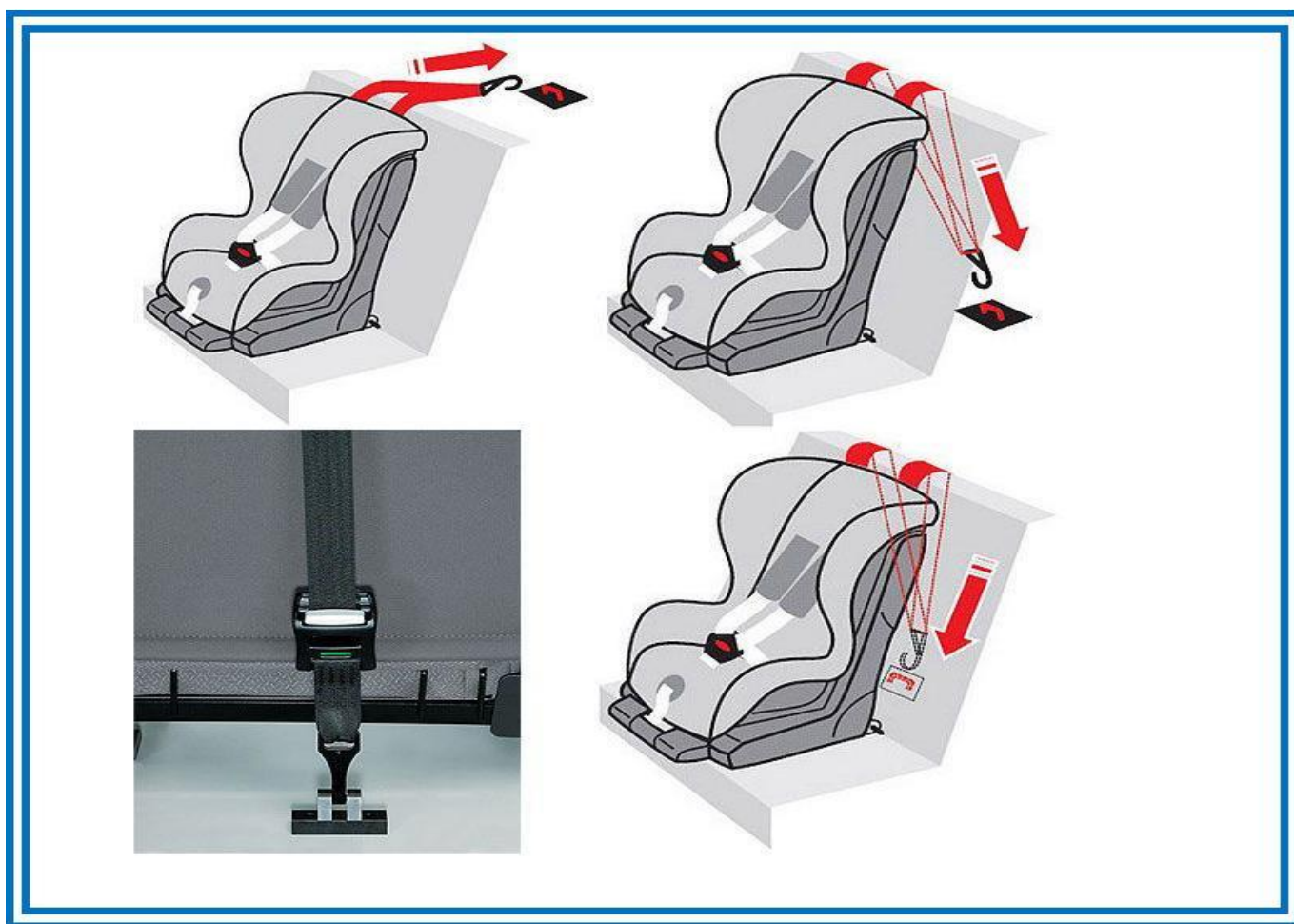
Рисунок 7. Способы фиксации якорного крепления

части спинки заднего дивана автомобиля. Как правило, место крепления «якоря» обозначено соответствующим рисунком (ребенок в автокресле с якорем, направленным назад).