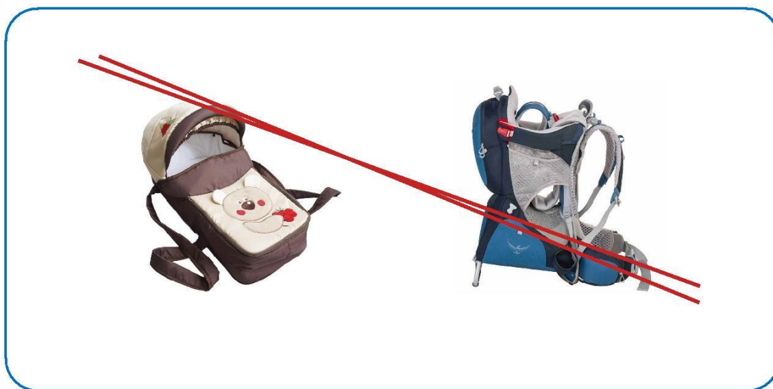
Рисунок 3. Внешний вид люльки-переноски

Люлька-переноска не предназначена для автомобиля